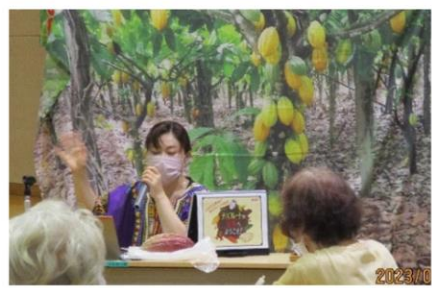
R5.9.20.チョコレートの世界へようこそ!

講師 (株)明治より テーマ『カラダは食べた物からできている』~元気な人生100年のためのヒント~