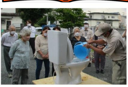
R5.6.21.山形市水道部『命をつなぐ水』

体験学習・野外見学・机上講習など、全5回の講座を通して、一緒に生きがいづくりを楽しみましょう!!