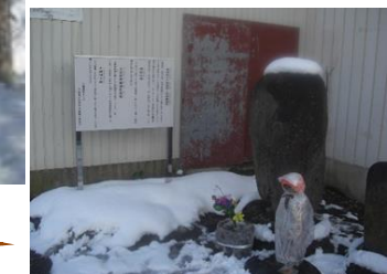
荷造り権現・供養塔