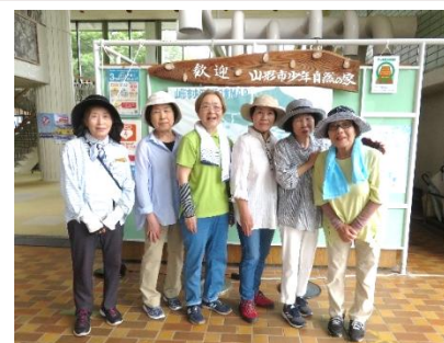
歩こう会(少年自然の家)