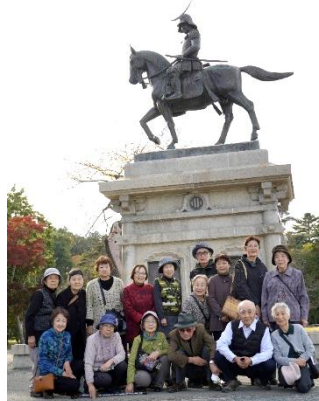
親睦旅行(遠刈田温泉・青葉城城址)