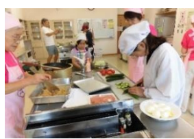
サンドイッチバイキング