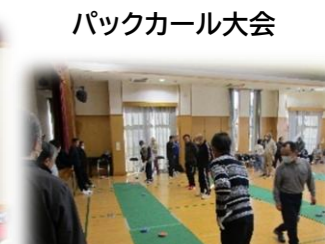
パックカール大会