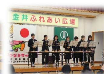
金井ふれあい広場