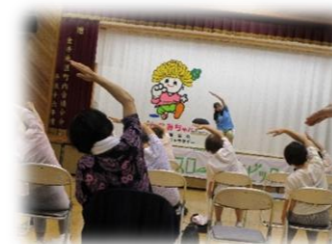
かなみ生き生き生活講座