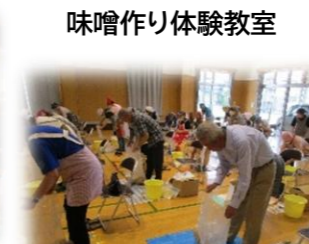
味噌作り体験教室