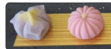
「ねりきり」のイメージ

※この事業は山形県職業能力開発協会の「ものづくり体験教室」として実施するもので、参加費は無料となります。