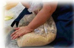
天然醸造味噌です