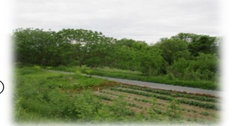
生い茂る多数の雑木