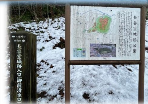
長谷堂城跡公園管理協力会