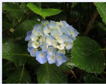
【小学生の部】青空みたいなあじさい