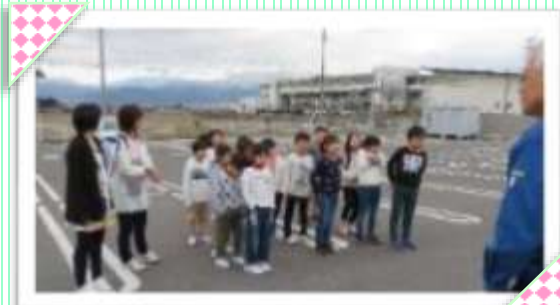
みんな集合！ 消火器を使って消火訓練を行いました。

3月8日(金) あじさい交流館で 児童クラブの子ども達と 避難訓練を行いました。