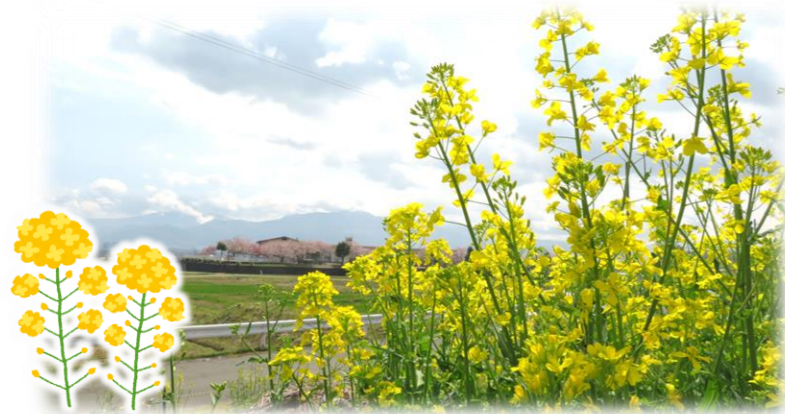
4月末現在、菜の花が満開です