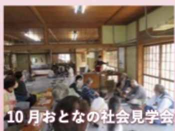
10月おとなの社会見学会