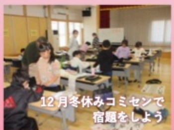
12月冬休みコミセンで 宿題をしよう