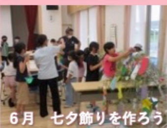
6月 七夕飾りを作ろう