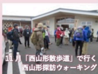
11月「西山形散歩道」で行く 西山形探訪ウォーキング