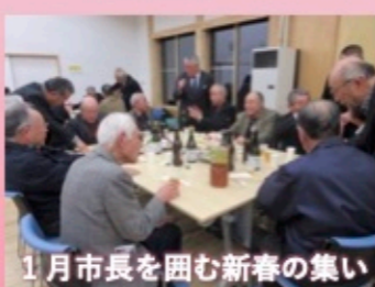
1月市長を囲む新春の集い