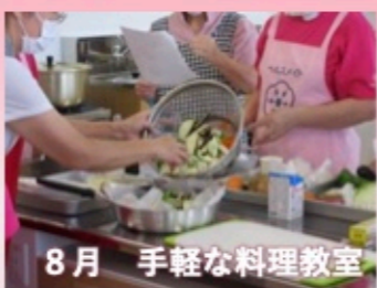
8月 手軽な料理教室