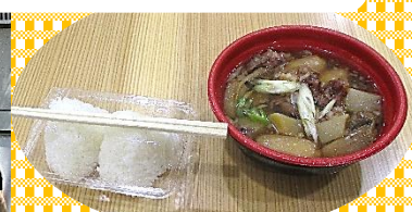
お昼ごはん 美味しい芋煮！