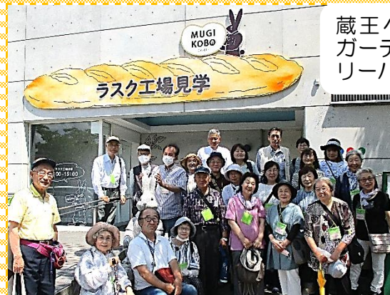
蔵王ペンション村オープンガーデンとシベールファクトリーパークを見学しました