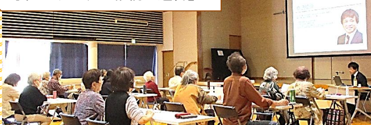
行政書士さんのお話を聞きました