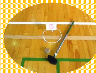
沼の辺体育館で思いっきりプレーしました！

令和8年度の募集は、「鈴川ふれあい館だより」4月号に掲載予定です。お友達と・ご夫婦で 参加してみませんか。皆様のご応募をお待ちしています！