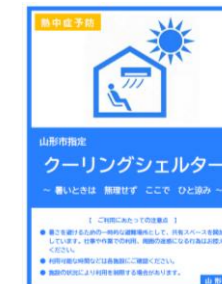
このポスターが目印

山寺地区の皆様、熱中症特別警戒アラートが発表された場合に限らず、暑いときは山寺コミュニティセンターをご活用ください。