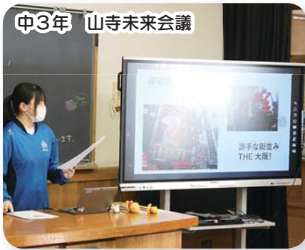
中3年 山寺未来会議

☆中学校3年生が修学旅行で学んだことを取り入れながら、これからの山寺地区をより良くするための「山寺未来会議」を開催。すばらしい内容の提案を実現できるように前進あるのみ!