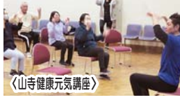
〈山寺健康元氣講座〉