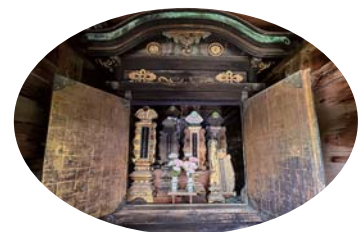
中性院境内修復前の御霊屋

がなされたと読み取れる。さらに、*明治34年から大正2年間に、中性院広場北側宝幢院(廃寺)敷地から現在の中性院前広場に移築されたところがある。*昭和6年の棟札には鞘堂屋根が大破し修復され、現在の姿に近いものとなったと報告が読み取れる。