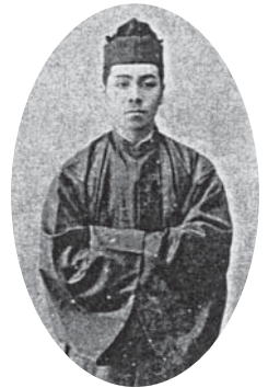
裁判所書記官 正装写真