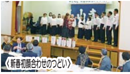
〈新春初顔合わせのつどい〉