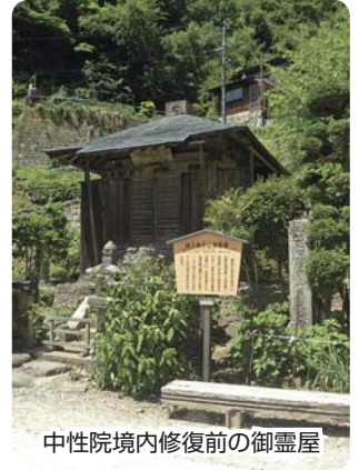
中性院境内修復前の御霊屋

中央の標記のバックの写真は宝珠山立石寺境内のお山の全景である。境内のお山には東の沢、中央に中の沢、左に西の沢筋がある。