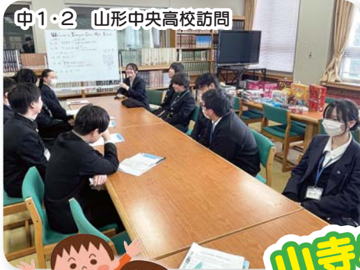
中1・2 山形中央高校訪問

☆山形中央高生とのゲーム 考案会議。タイトルは「山 寺タイムライン」でさらに「山 寺を楽しく」!!